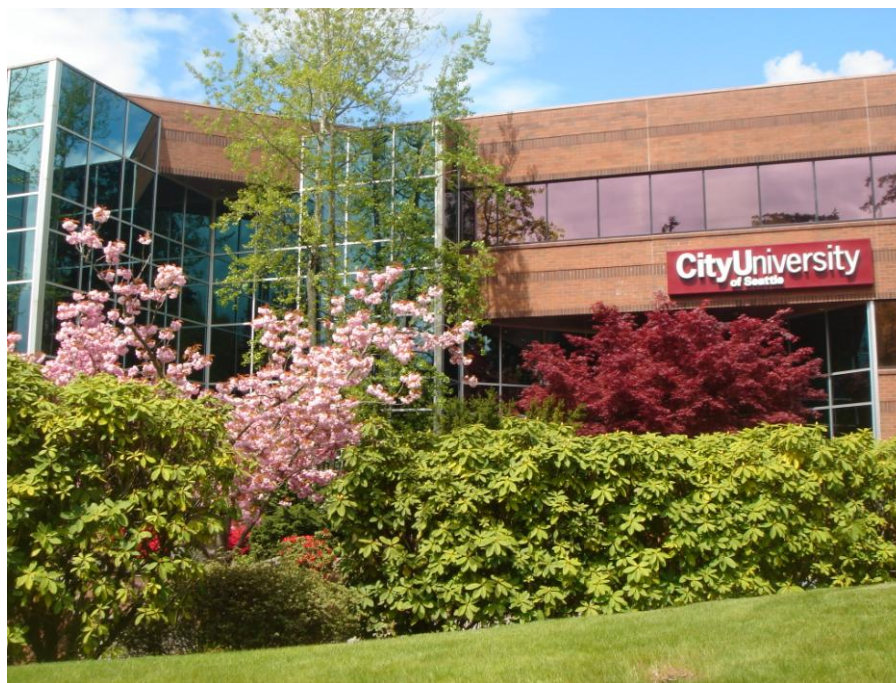
Centrála City University of Seattle v Bellevue

Medzinárodná vedecká spolupráca našej školy sa intenzívne rozvíjala aj v roku 2009. Na viacerých publikáciách sa podieľajú aj zahraniční spoluautori. Okrem toho medzi spoluautormi monografií je tiež veľa zahraničných prispievateľov. To naznačuje široký vedecký potenciál našej školy. Medzinárodná spolupráca Vysokej školy v pedagogickej oblasti sa opiera predovšetkým o spoluprácu s zriaďovateľom – City University of Seattle – v USA a v jej európskych pobočkách. Existuje intenzívny program výmeny učiteľov a zamestnancov obidvomi smermi. Naši vyučujúci v rámci tejto výmeny pôsobili v Bulharsku, Česku, Grécku a Rumunsku po dobu od 1 týždňa až po 3 mesiace. Na týchto partnerských univerzitách prednášalo spolu 12 našich učiteľov, pričom celková doba ich pobytu tvorí viac ako 300 dní.