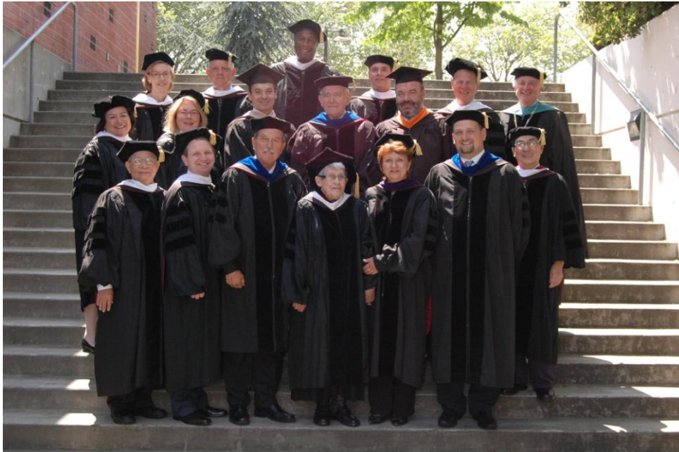
Spoločná fotografia Správnych rád VŠM a City University of Seattle, Key Arena - Seattle, USA

V júni sa okrem štátnic a promócie študentov konala medzinárodná letná škola „Introduction to Knowledge Management“ v dňoch 21. júna do 4. júla v Trenčíne. Na letnej škole sa zúčastnilo 20 študentov a 9 pedagógov z Fínska, Litvy, Českej Republiky a Slovenska. Jej súčasťou bol aj medzinárodný workshop „Knowledge Management“, ktorý sa konal 26. júna v hoteli Rysy v Tatranskej Štrbe za účasti ďalších zahraničných prednášateľov z Maďarska a Spolkovej Republiky Nemecko.