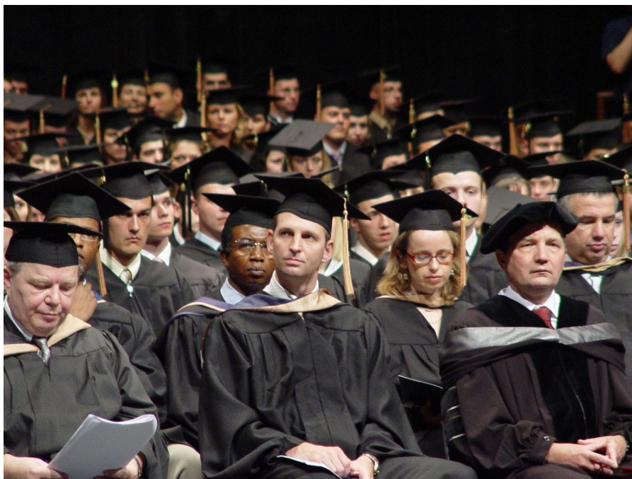
Slávnostné promócie VŠM a City University of Seattle