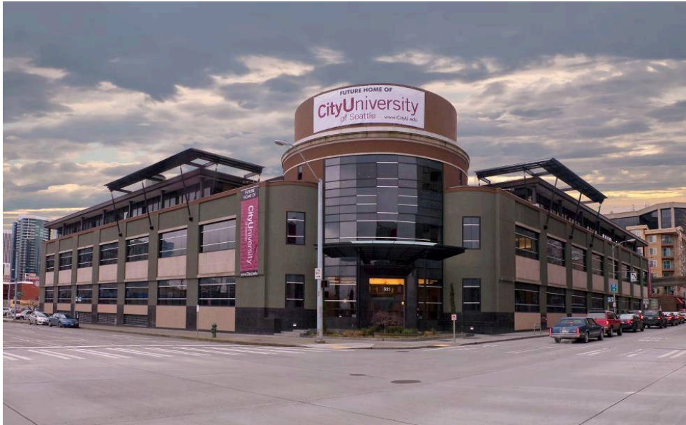
Sídlo centrály City University of Seattle v Seattle

V rámci spolupráce s City University of Seattle po úspešnom absolvovaní trojročného bakalárskeho štúdia na Vysokéj škole manažmentu a získaní (slovenského) bakalárskeho diplomu môže študent po absolvovaní štvrtého ročníka získať aj bakalársky stupeň vysokoškolského vzdelávania akreditovaný v USA, ktorý mu udelí City University of Seattle v USA. Od roku 2007 majú študenti VŠM možnosť absolvovať časť štúdia na niektorej z pobočiek City University of Seattle v USA za rovnakých finančných podmienok, ako na Slovensku.