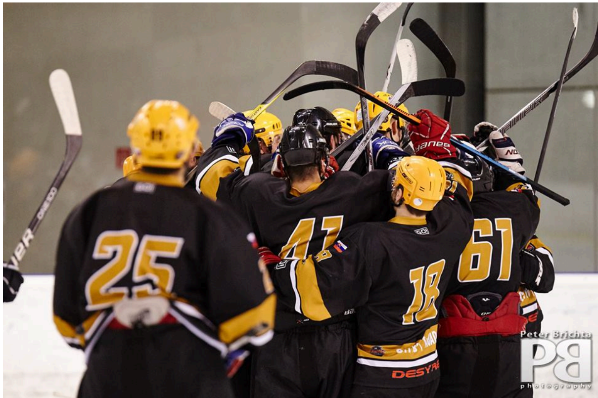
tím Trenčín Gladiators

V roku 2016 VŠM pokračovala s projektom podpory študentov ako prostredníctvom kariérneho centra, tak ponukou internshipov a študentských stáží. Cieľom týchto aktivít je na pôde školy pomôcť končiacim študentom a začínajúcim firmám lepšie sa adaptovať na profesionálnu kariéru po ukončení štúdia.